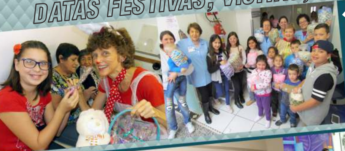
Voluntários animaram a Páscoa e o Dia das Crianças na FUNDEF Doação da Ibec, Homenagem recebida na Assembleia Legislativa e visita de representantes da Fundación Social Gracias a Dios un Niños Sonríe