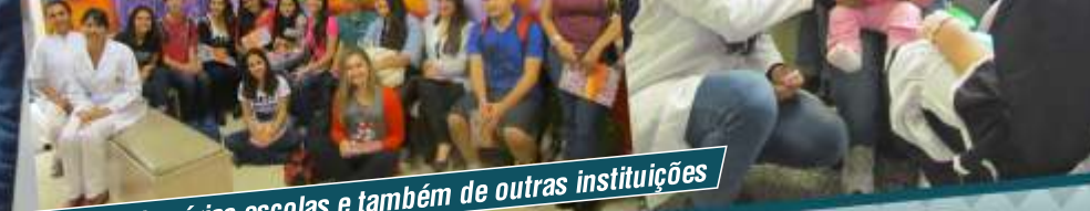
Durante o ano de 2015 a FUNDEF recebeu a visita de alunos de várias escolas e também de outras instituições