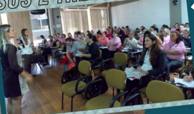
FUNDEF realizou curso para agentes de saúde