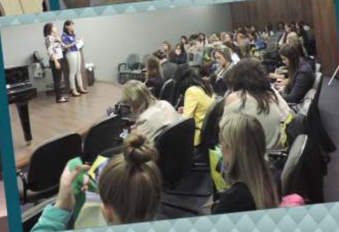
Capacitação promovida pela FUNDEF para fonoaudiólogas do Estado