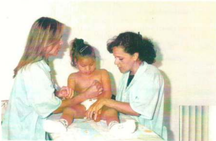
Pediatria, Paciente e Enfermeira