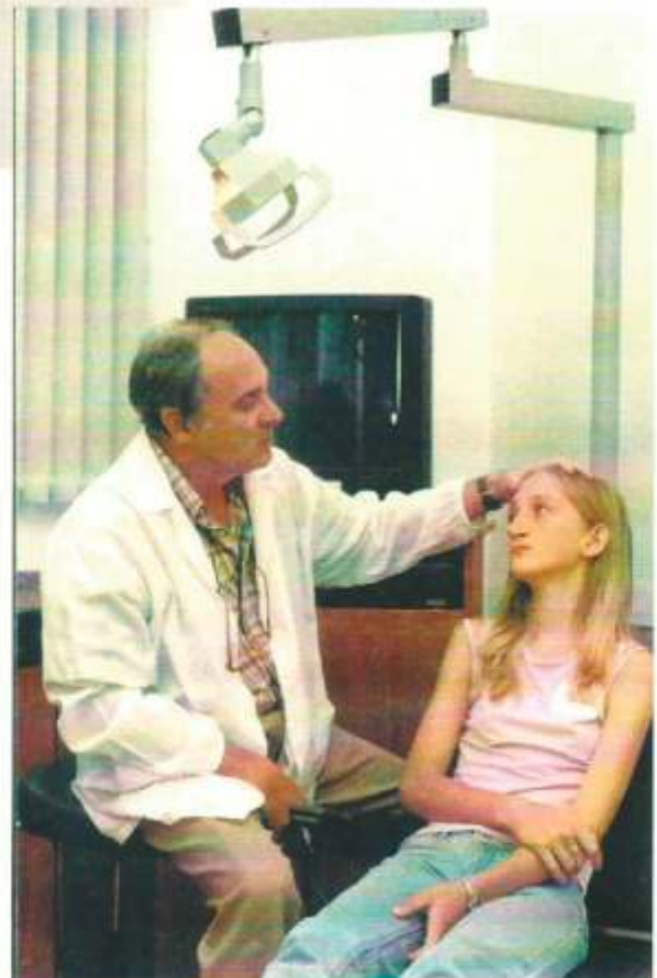
Cirurgião e Paciente