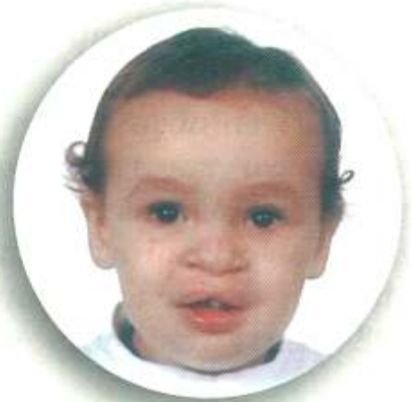
Após 2ª cirurgia