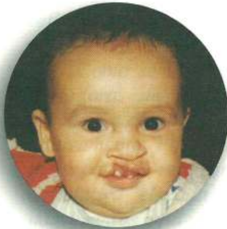
Após 1ª cirurgia